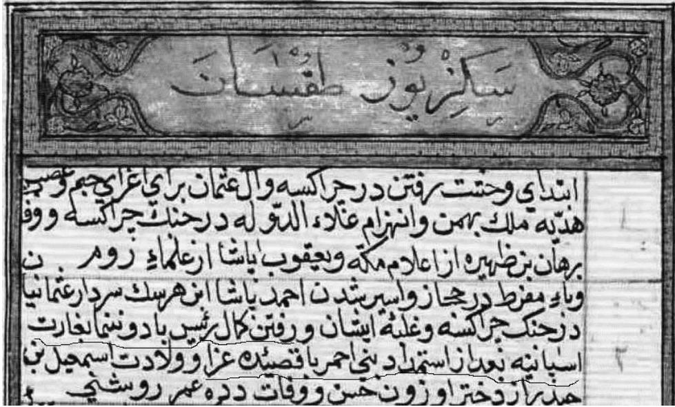
Ek 1. Kâtip Çelebi'nin Takvîmü't-tevârîh Eserine Aldığı Kronolojik Kayıt (Süleymaniye Kütüphanesi Çelebi Abdullah Koleksiyonu, no. 257, v. 60b)