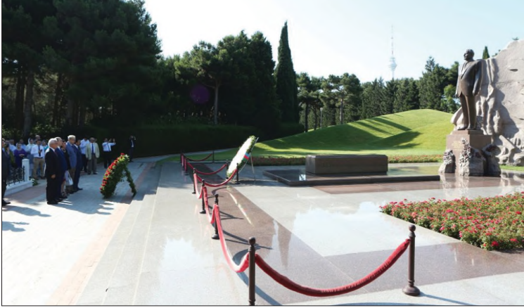
Beynəlxalq Simpoziyumun iştirakçıları Fəxri xiyabanda

11 iyul 2019-cu il tarixdə Azərbaycan İlahiyyat İnstitutu (Aİİ), İslam Tarixi, İncəsənəti və Mədəniyyəti Araşdırma Mərkəzi (IRCI-CA) və AMEA akademik Z.M.Bünyadov adına Şərqsünəşliq İnstitutunun birgə təşkilatçılığı ilə keçirilən “İslam Sivilizasiyası Qafqazda” II Beynəlxalq Simpoziumu öz işinə başlayıb.