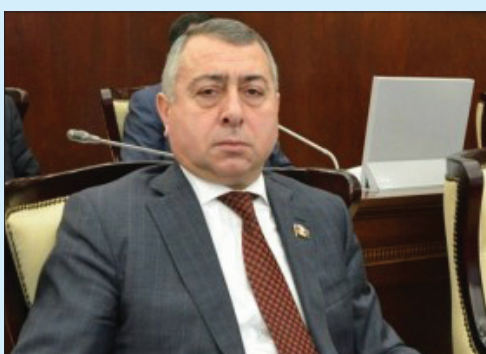
RAFAEL CƏBRAYILOV, Milli Məclisin deputatı

reportajların, mənbələrin bu qəzetdə dərc olunması təhrif olunan və radikalığa sürüklənən dinçiliyin sütunlarının sarsıtılmasına böyük töhfə verə bilər. Ümid edirəm ki, qəzetin yaradıcı heyəti öz araşdırmaçı əzmi ilə ölkəmizdə ən oxunaqlı və dini maarifçiliyə xidmət edən bir qalıcı mətbu orqan yaradacaqlar. Gənclərin bu qəzetin ən həvəsli izləyiciləri olacağına da inamım böyükdür. Qəzetin ərəsəyə gəlməsində zəhməti olan hər bir kəsi təbrik edir, çalışmalarıңызda uğurlar diləyirəm.