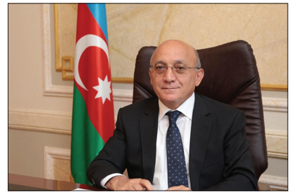
MÜBARİZ QURBANLI, Dini Qurumlarla İş üzrə Dövlət Komitəsinin sədri

Yaradıcı işində “İlahiyyatçı” qəzetinin kollektivinə uğurlar arzulayıram!